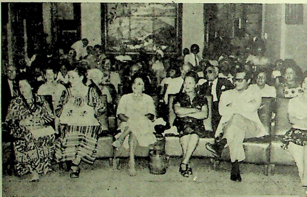
Una parte de la concurrencia que asistió a la velada lírico-cultural.

Ofrecemos dos vistas de esta Velada Musical.