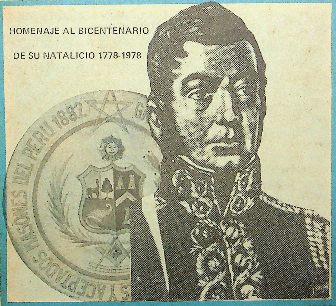
R.: H.: JOSE DE SAN MARTIN LIBERTADOR Y PROTECTOR DEL PERU

HOMENAJE AL BICENTENARIO DE SU NATALICIO 1778-1978