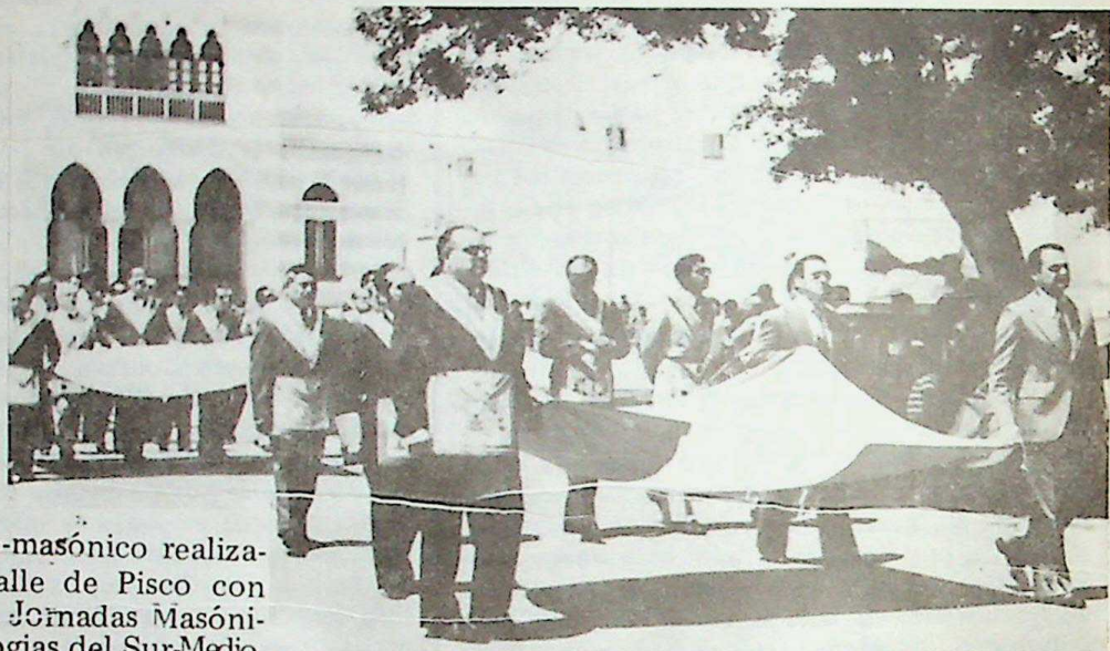
Desfile cívico-masónico realizado en el Valle de Pisco con motivo de las Jornadas Masónicas con las Logias del Sur-Medio.