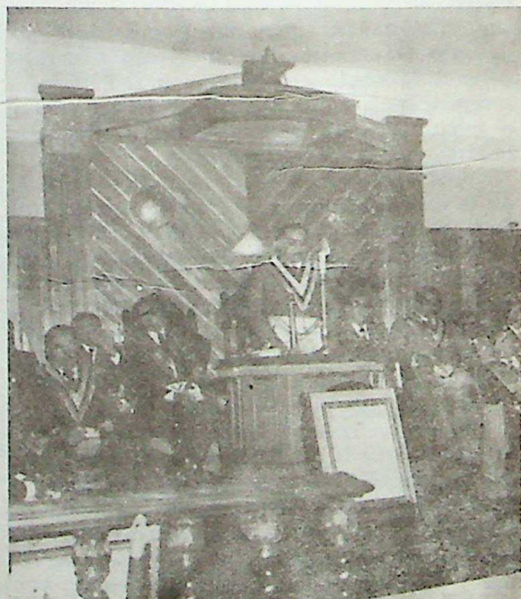
Ten.: en Cad.: celebrada por la R.: L.: S.: Bernardo O'Higgins No. 102 en homenaje al prócer patrono. Asistió el Gran Maestro y miembros de su Gabinete.